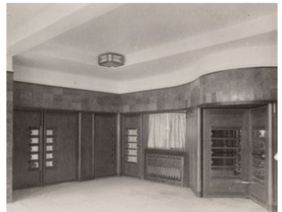
De hal in 1925.

Het pand op de kop van de Overtoom, aan de Stadhouderskade 1, werd gebouwd als het administratiekantoor van de Amsterdamse Gemeentetram. Het is, evenals de bijbehorende portiersloge/fietsenstalling, sinds 1995 een rijksmonument. Ten behoeve van de herontwikkeling van het complex voerden we een (beknopt) cultuurhistorisch onderzoek uit. Na een schets van de totstandkoming en het toenmalige plan van eisen voor het gebouw zijn per verdieping bouwfaseskaarten gemaakt en is een lijst met wijzigingen opgesteld. In de archieven vonden we zowel de originele bouwtekeningen als het bestek, waardoor vrij precies de oorspronkelijke situatie kon worden beschreven. De opbouw en architectuur van de gevels van het administratiekantoor is reeds uitgebreid beschreven in de gebouwbeschrijving van de Rijksdienst voor Cultureel Erfgoed.